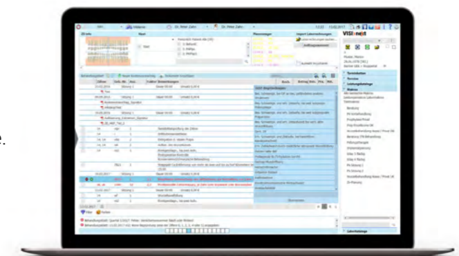
VISI>next Modul „Behandeln“

„Als Zahnmedizinische Fachangestellte muss es für mich schnell gehen.“